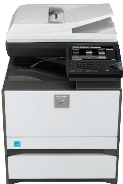
MXC301W avec l'option entrée papier